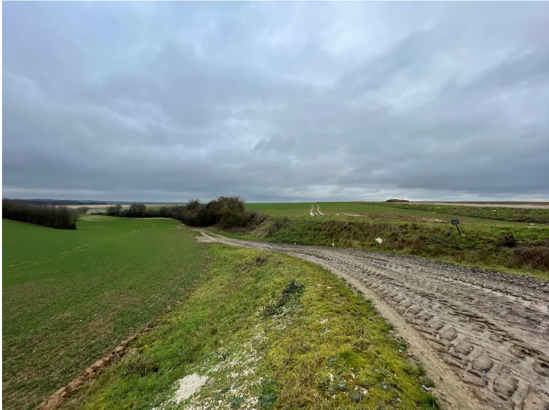
Figure 3 : cliché 2_1