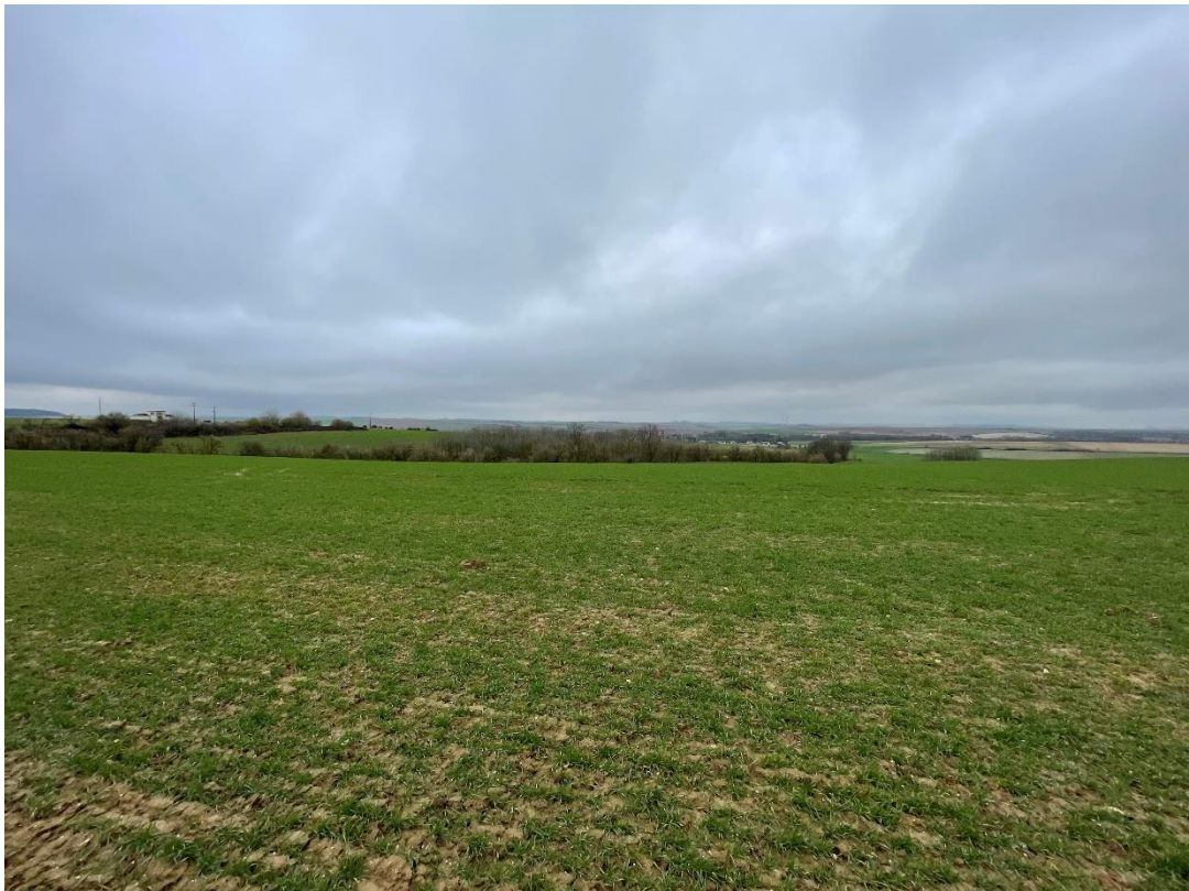
Figure 4 : cliché 2_2