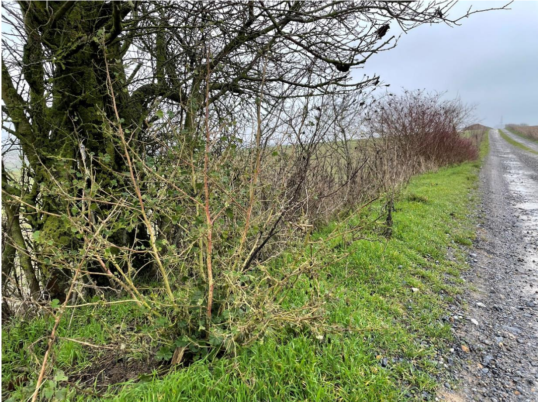
Figure 9 : cliché 5_2