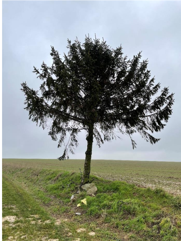
Figure 7 : cliché 4_2