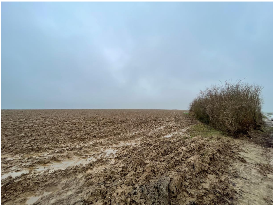
Figure 12 : cliché 6_3