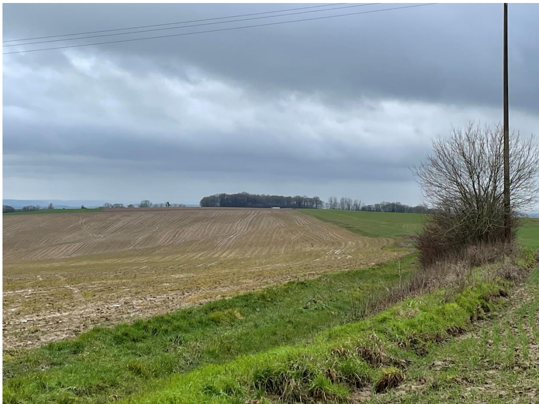
Figure 2: cliché1_2