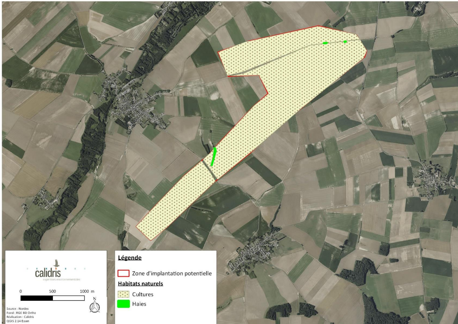
Carte 3 : Habitats naturels observés en 2021