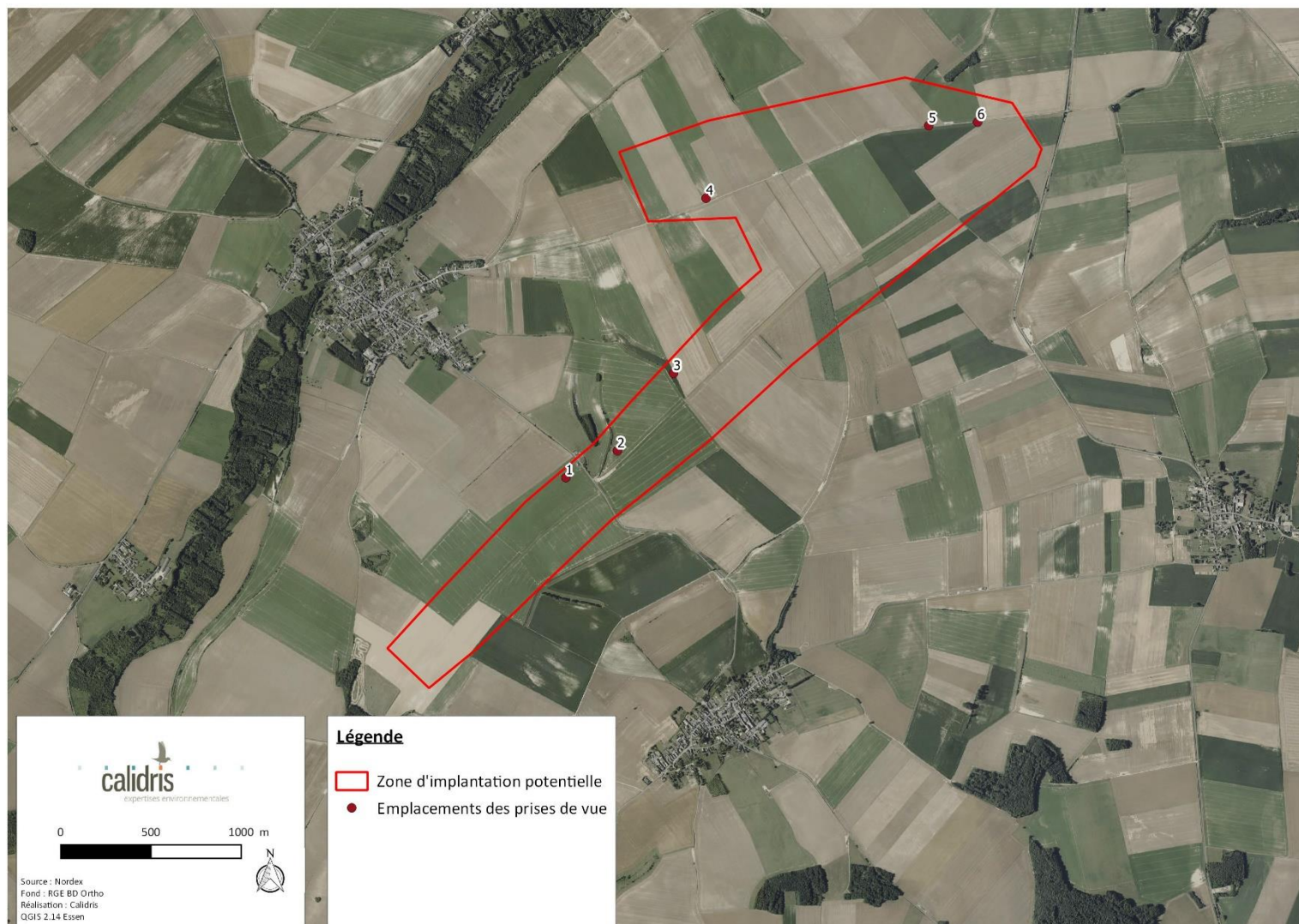
Carte 2 : Localisation des prises de vue photographiques