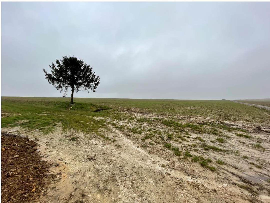
Figure 6: cliché 4_1