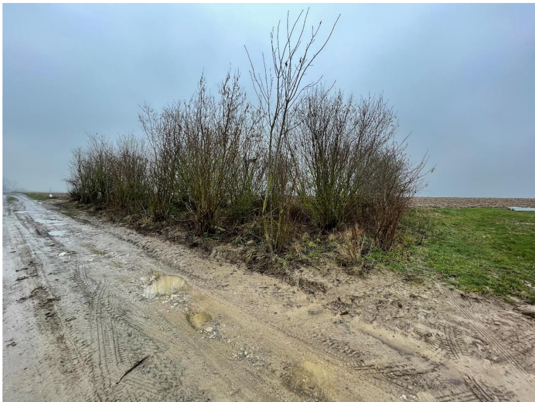
Figure 10 : cliché 6_1