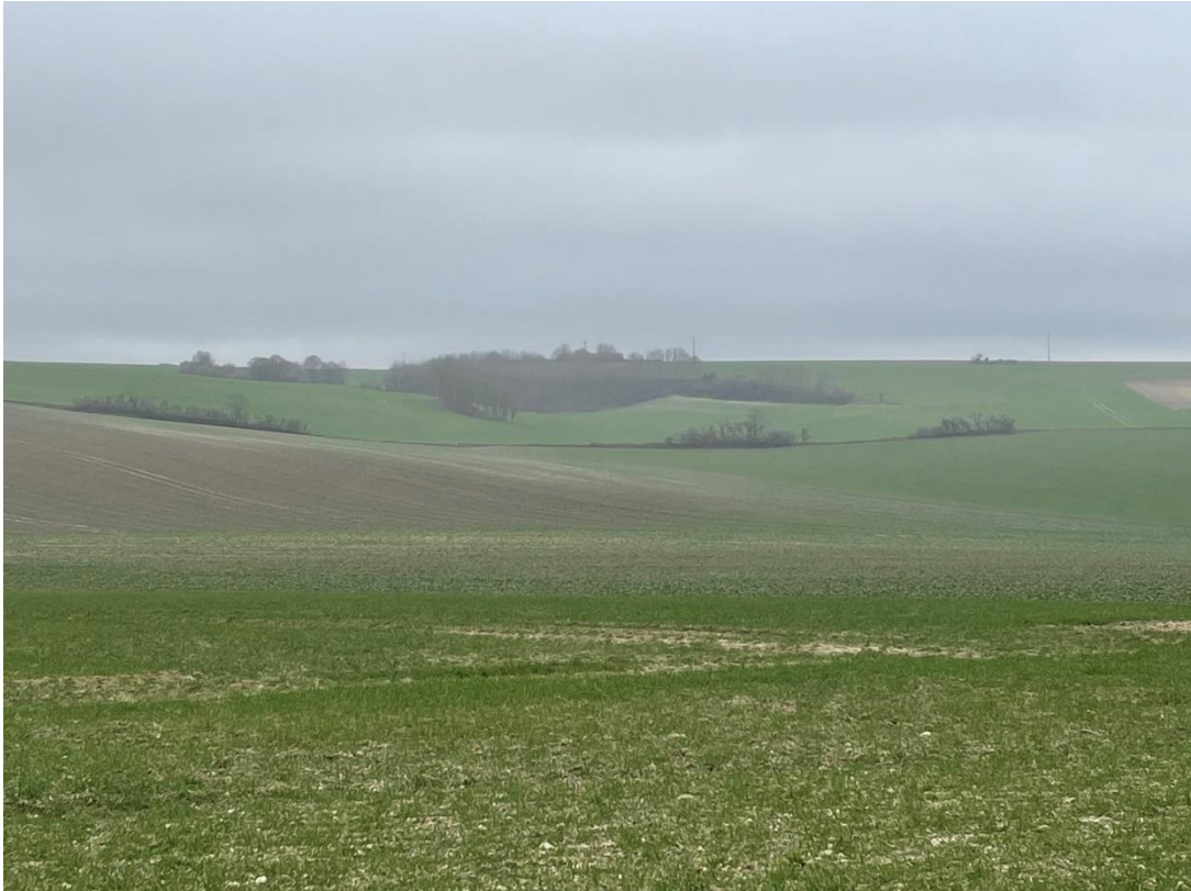
Figure 5 : cliché 3_1