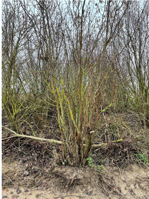
Figure 11 : cliché 6_2