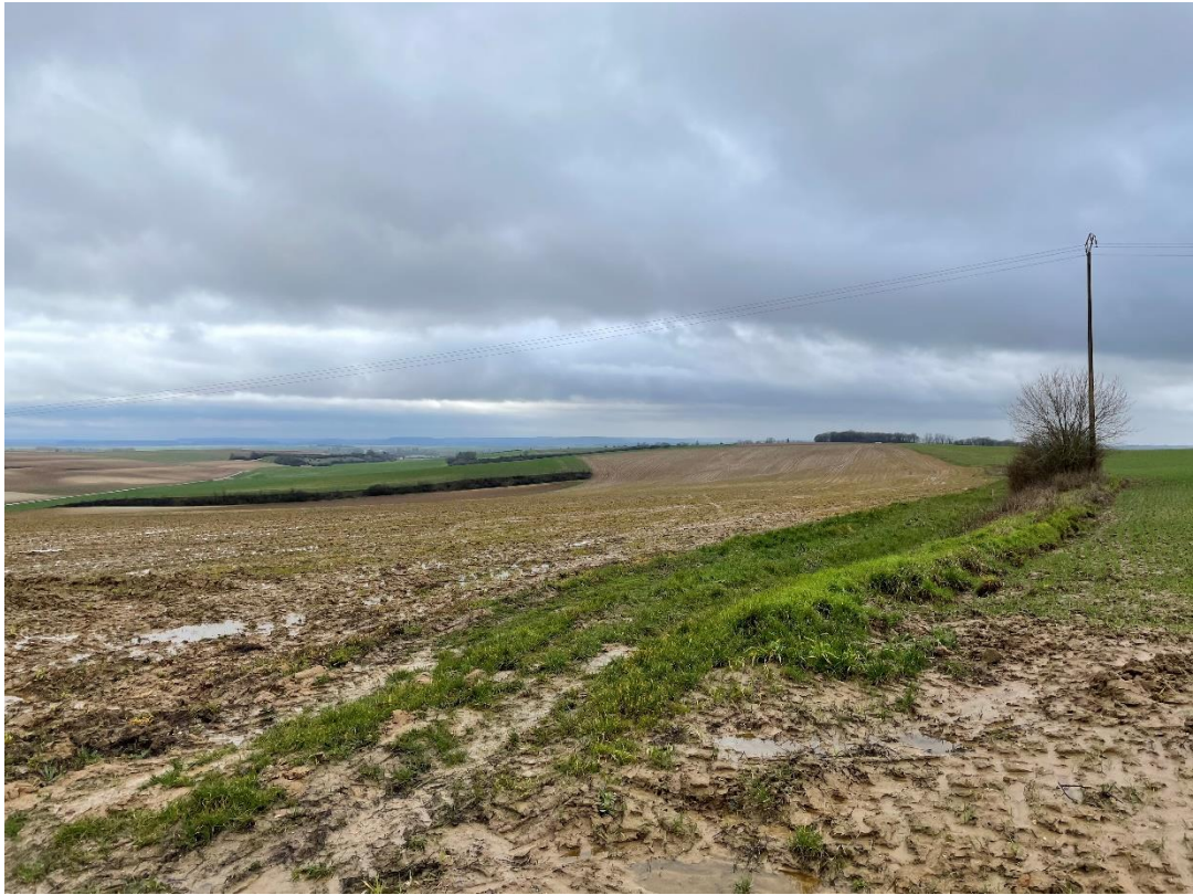
Figure 1 : cliché1_1