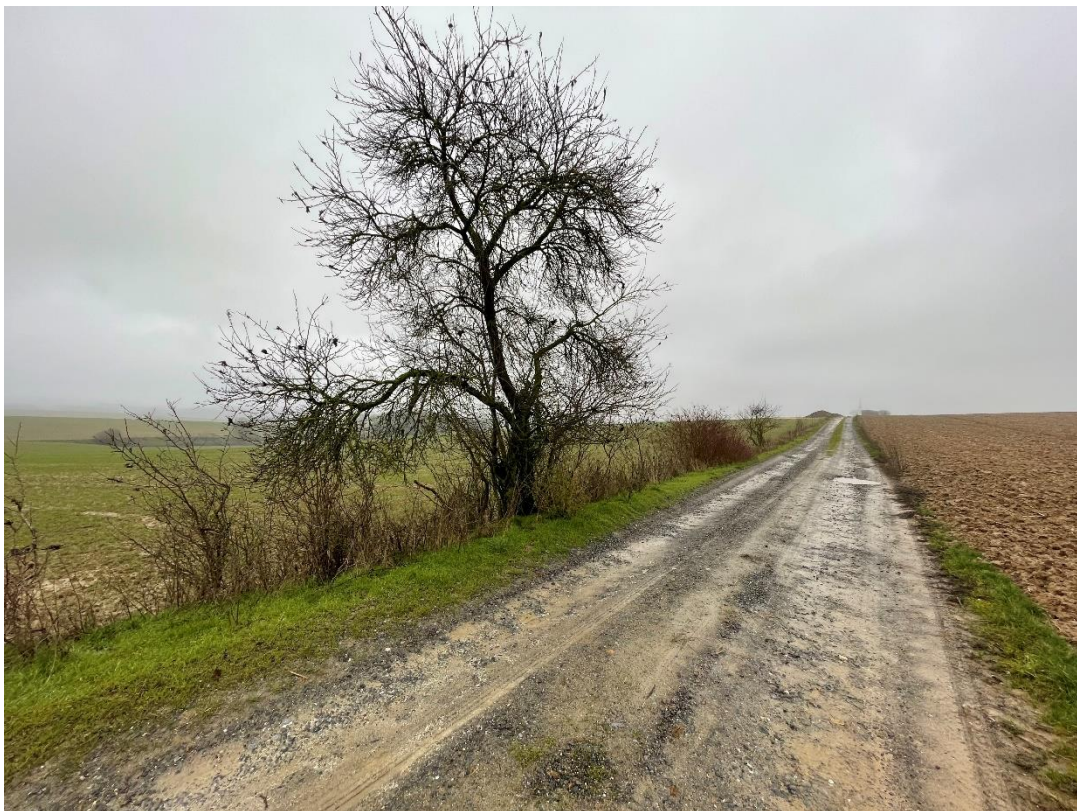
Figure 8 : cliché 5_1