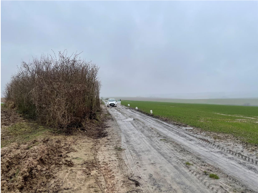
Figure 13 : cliché 6_4

La cartographie actualisée des habitats naturels est présentée sur la carte suivante. Les cultures occupent toujours l'intégralité de la ZIP et la haie observée en 2015 au centre de la ZIP est toujours présente et couvre le même linéaire.